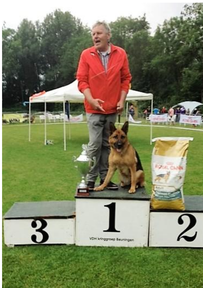
Xelli van Harbajahof IPO3 KKI.