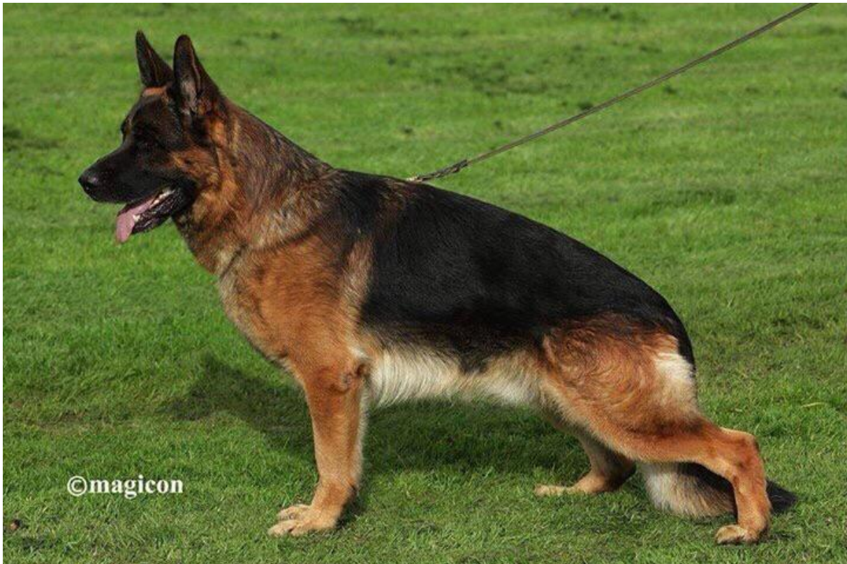
VEGAS FEETBACK IPO3 Kkl.