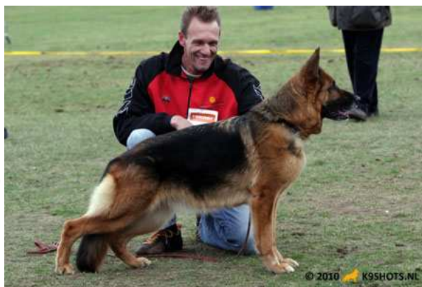
Falida v Frankengold Beste kynologische hond Gelderland PCM2011