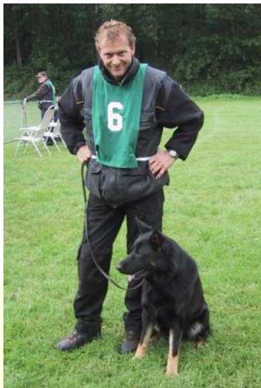
Barros vom Pferdeberg Africhtingskampioen PAK2011

(t.b.v. Voorjaarsledenvergadering 30 maart 2012 )